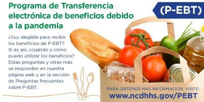
GRÁFICO PARA PUBLICAR CON EL TEXTO

¿Tiene preguntas sobre quién es elegible para el programa de Transferencia Electrónica de Beneficios por Pandemia (P-EBT) de Carolina del Norte y cómo usar los beneficios? Estas preguntas y más se responden en nuestra página web y en la sección Preguntas frecuentes del P-EBT. Visite www.ncdhhs.gov/PEBT #NCPEBT