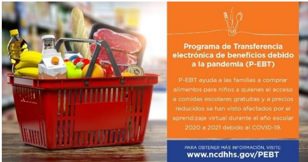
GRÁFICO PARA PUBLICAR CON EL TEXTO

Los beneficios del P-EBT de Carolina del Norte recibidos en febrero serán por los meses de agosto a diciembre de 2020. Los beneficios por cada mes elegible se recibirán a lo largo de varios días para evitar sobrecargar a los minoristas de alimentos y abarrotes autorizados. Aquellos que no tienen una tarjeta EBT y son elegibles durante estos meses, deberían prever recibir su tarjeta por correo en febrero o marzo. Visite www.ncdhhs.gov/PEBT #NCPEBTT