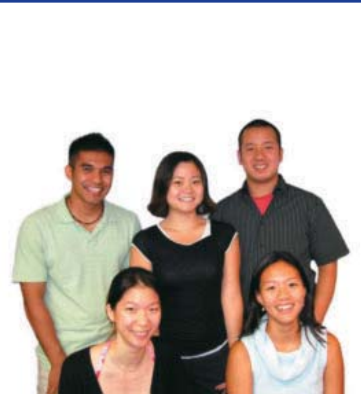
Qhov ntawm no, yog Federal txojcai uas pub kev ncaj nceeg rau koj. Tsab kev cai ntawm no, hu ua Title VI ntawm txuj cai Civil Rights Act ntawm xyoo 1964.