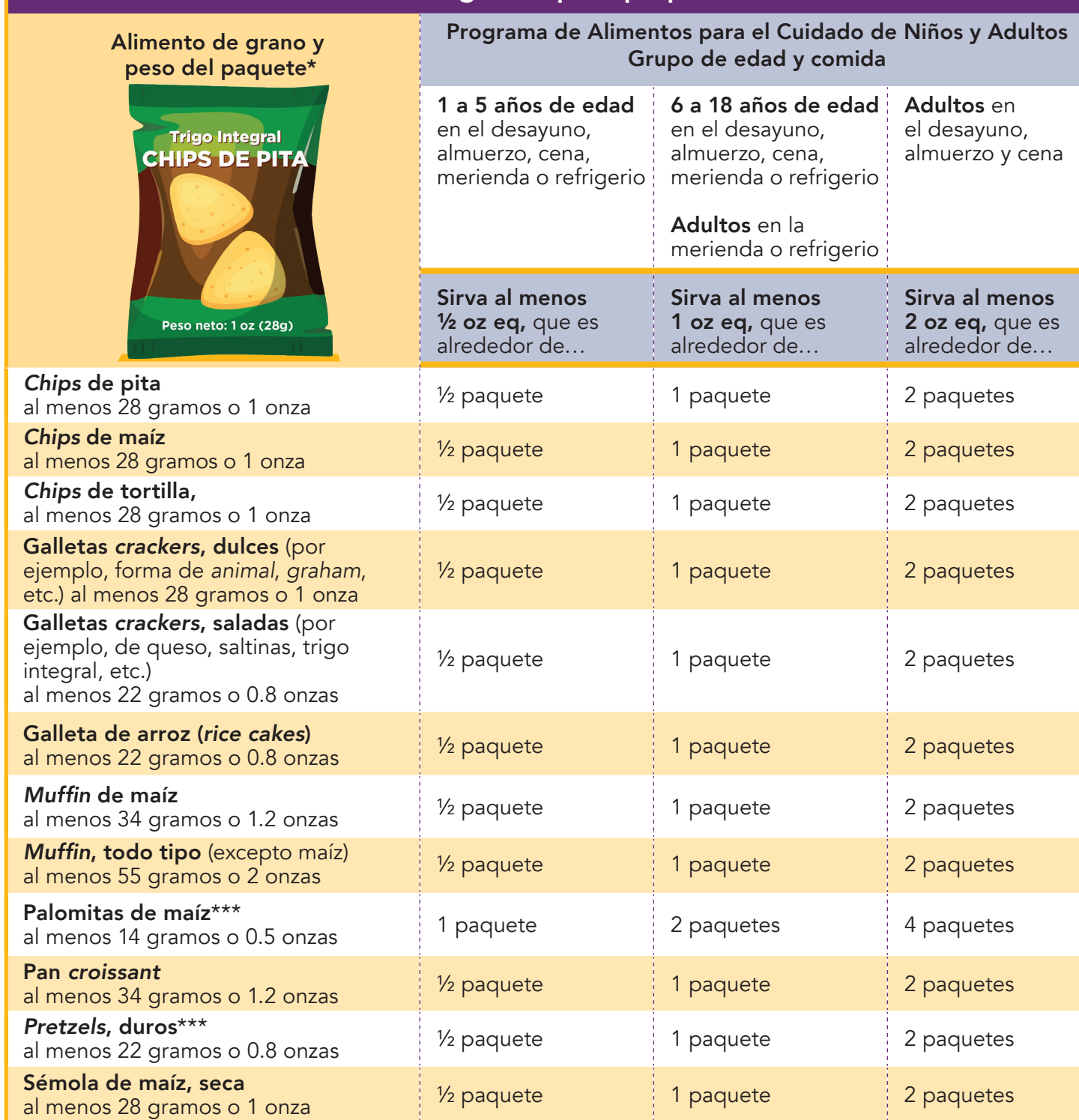
Tabla de medida de granos para paquetes individuales

*Verifique si el paquete que desea servir pesa esta cantidad o más. Consulte "Cómo encontrar el peso de los paquetes individuales" en la página 4 para más información.